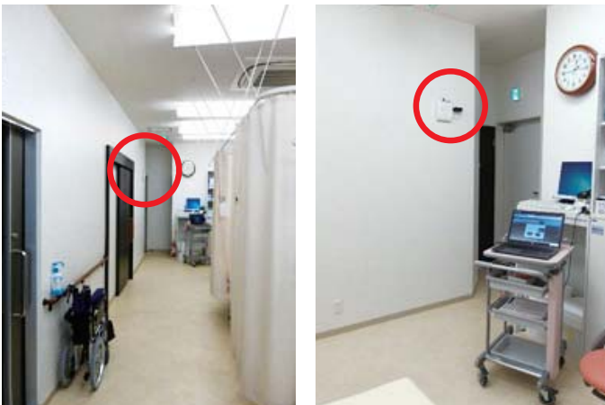
無線LANアクセスポイントのおかげでケーブルレスになりベッド間の移動が可能に

電子カルテを搭載したノートPCを医療器具などを入れたキャスターつきのカートに載せ、看護師が患者様の治療中のベッドを移動して診察できるようにしました。 ベッド周りには電子機器類のケーブルを排除し、スムーズに移動できるようにするとともに、画像データ・検査データなどもその場で閲覧・入力できるようにしています。